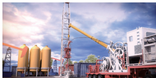
连续油管增产技术